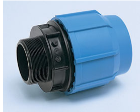
Rak koppling utv. eller inv. gg